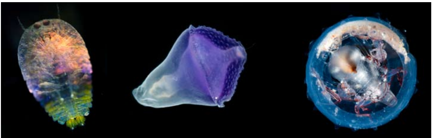
Photo 1 : ©C.Sardet-CNRS-Tara-Oceans Photos 2 et 3 : Organisme marin ©M.Ormestad-Kahikai-Tara Oceans / http://www.planktonchronicles.org